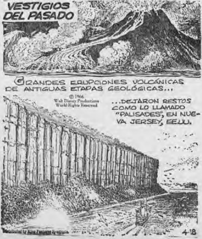
...DEJARON RESTOS COMO LO LLAMADO "PALISADES" EN NUEVA JERSEY, E.U.U.